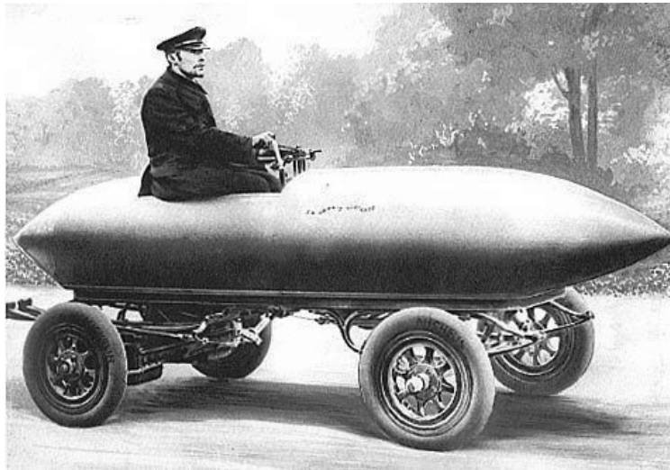
Camille Jenatzy à bord de la Jamais contente.

A l'occasion de la parution du flipbook La Jamais contente et du baptême officiel de la place du même nom à Achères le samedi 25 octobre 2014, la Bibliothèque Multimédia Paul Eluard présente son fonds riche sur l'automobile à travers cette bibliographie thématique.