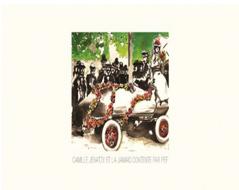
Camille Jenatzy et la Jamais contente par Pef

Drive / Nicolas Winding Refn ; Ryan Gosling, Carey Mulligan, Bryan Cranston. - Neuilly-sur-Seine : Warner Home Video, 2012. - Date du film : 2011. Cote : REF En commande